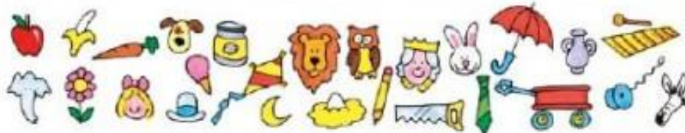
ILLUSTRATION: M. L. GARCÍA / KANGAROO

https://activitea.es/actividades-imprimibles/agudeza-visual/ https://drive.google.com/file/d/0B40v9G-W09mbb29WSlppR0F3LXc/view